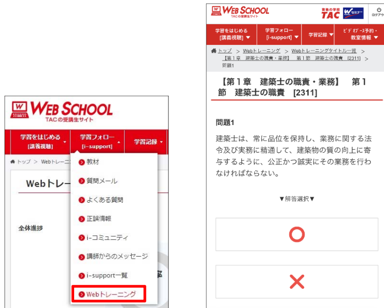
Webトレーニング画面