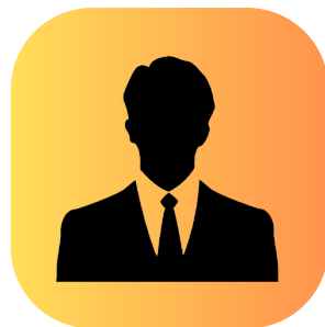
担当 ライセンス アドバイザー

働きながら合格するためのポイントとは？社会人の方を対象に、受験の心構えや効率的な学習方法をお伝えします。終了後は皆様のご質問・ご相談も承ります。