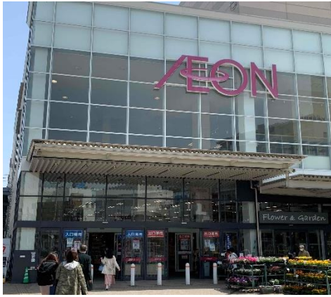
こちらが「正面入口です。」