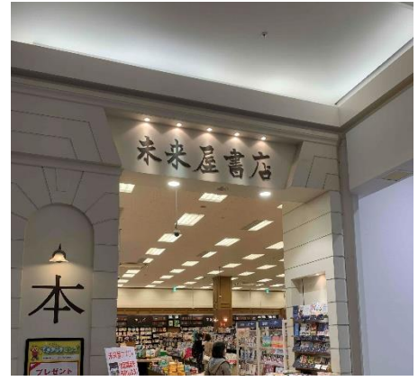
3階の一番奥、「未来屋書店」の隣が TAC津田沼校です！