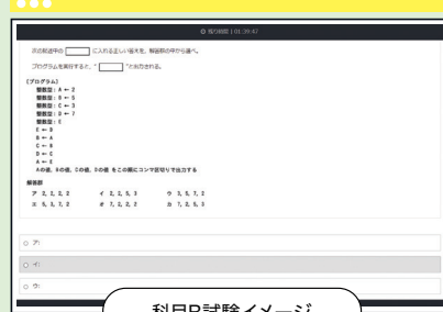
科目B試験イメージ