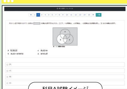
科目A試験イメージ