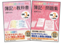
A5・フルカラー(問題集は2色刷)