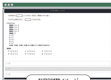
科目B試験イメージ