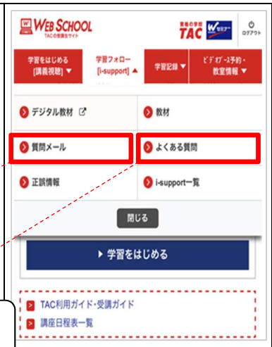
[スマートフォン画面]

疑問点や不明点があったら、まずは「よくある質問」をご覧ください。一般的に多い質問や他の方がすでに質問した事項をデータベースに集めてありますので、疑問に思う項目を探すことができます。