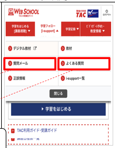
[スマートフォン画面]

疑問点や不明点があったら、まずは「よくある質問」をご覧ください。一般的に多い質問や他の方がすでに質問した事項をデータベースに集めてありますので、疑問に思う項目を探すことができます。