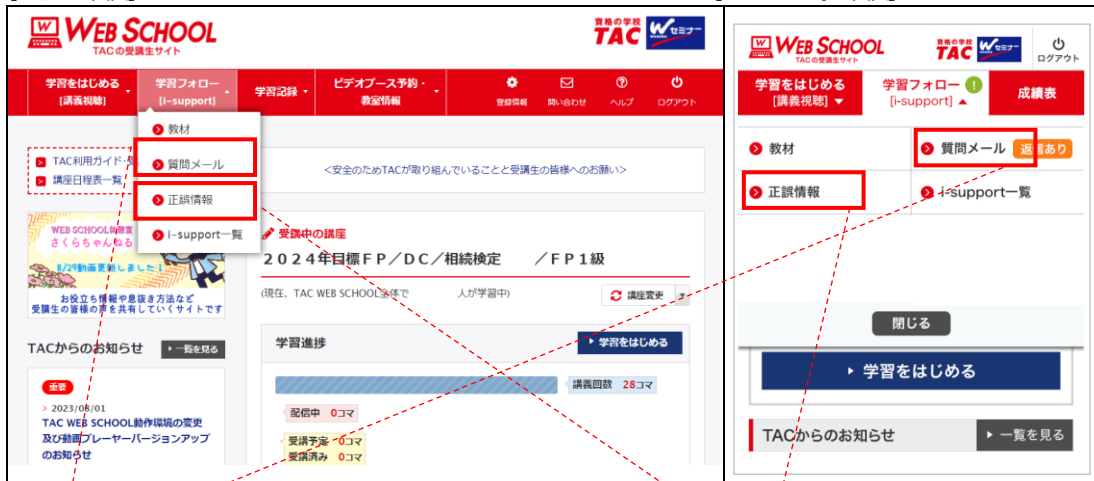
[スマートフォン画面]