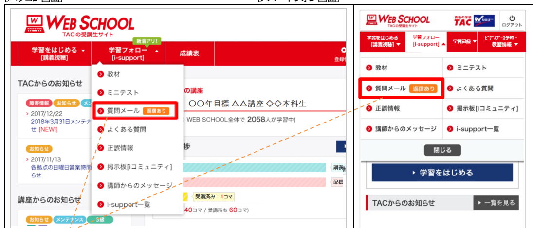
[スマートフォン画面]