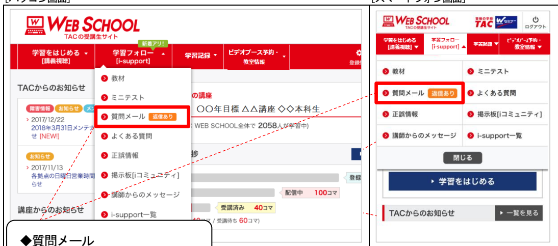
[スマートフォン画面]