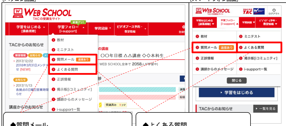
[スマートフォン画面]