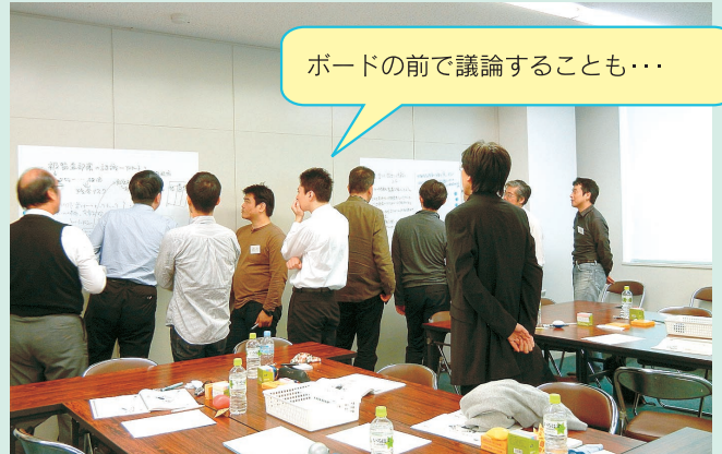
ボードの前で議論することも...

※TAC主催のファシリテーション・トレーニングは、日本内部監査協会公表のCCSA認定トレーニング規準に沿って実施いたします。トレーニング規準に関しては、日本内部監査協会HPにてご確認ください。