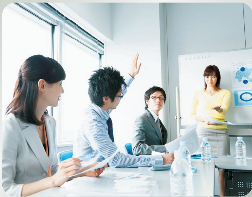
ファシリテーション・ミーティング(イメージ)

1 CCSA(内部統制評価指導士)資格認定要件のうち、 ファシリテーション経験の要件を満たす!*