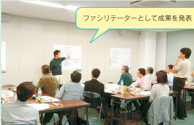
ファシリテーターとして成果を発表