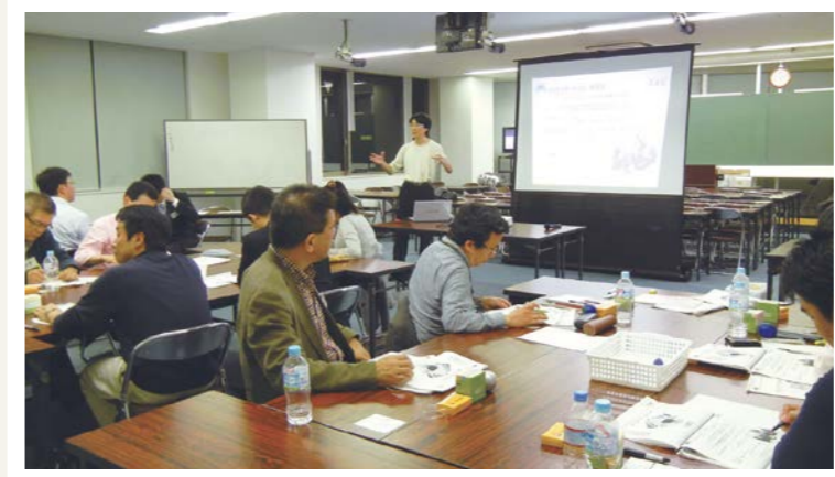
※TAC主催のファシリテーション・トレーニングは、日本内部監査協会公表のCCSA認定トレーニング規程に沿って実施いたします。トレーニング規程に関しては、日本内部監査協会HPにてご確認ください。